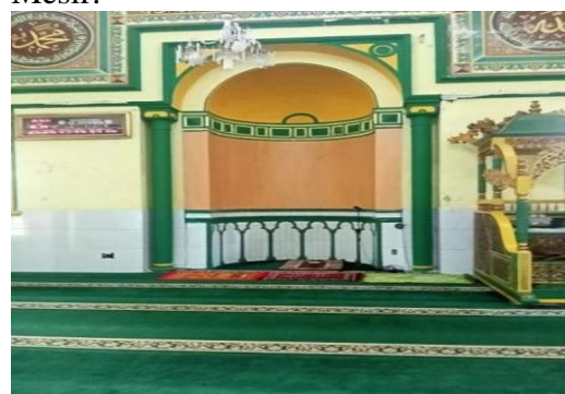
Gambar 5. Mihrab

Mihrab masjid Al Osmani menggunakan cat berwarna kuning keemasan. Pada dinding mihrab juga terdapat lis dinding yang diberikan cat berwarna hijau. Penggunaan keramik juga diterapkan pada dinding bagian bawah mihrab. Pada dinding mihrab terdapat ornamen geometri dengan cat berwarna hijau. Pada bagian atas dinding mihrab terdapat lengkungan berbentuk lingkaran khas Arsitektur Mesir.