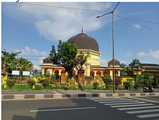
Gambar 1. Masjid dari Depan

Masjid Al-Osmani terletak di Jalan Yos. Sudarso km 17,5 tepatnya berada di wilayah Desa Pekan Labuhan, Kecamatan Medan Labuhan, Kabupaten Medan, Provinsi Sumatera Utara. Kawasan masjid Al-Osmani berada di Jalan Yos Sudarsodengan luas lahan 1 hektar yang pada sisi lahan dibatasi oleh pagar dan terdapat gapura di sebelah selatan yang difungsikan sebagai gerbang masuk kawasan Masjid Al-Osmani. Ketika kita melintas di depan masjid ini, masjid ini sangat terlihat megah dan mencolok dari pinggir jalan Yos Sudarso, karena warna kuning hijau khas melayu dan pemilihan warna hitam pada atap yang menambah kesan megah bangunan bersejarah ini. Gerbang masuk yang asimetris ini menambah kesan welcoming pada kompleks masjid ini, gerbang masuk masjid tampak dari jalan ruang wudhu Masjid Al Osmani.