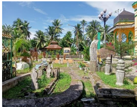
Gambar 3. Pemakaman

Pemakaman masjid ini terdapat lima makam Sultan Deli yang pernah berkuasa di Istana Labuhan Deli, mereka adalah : Tuanku Panglima Pasutan (Sultan Deli ke- 4), Tuanku Panglima Gandar Wahid (Sultan Deli ke-5), Sultan Amaluddin Perkasa Alam (Sultan Deli ke 6), Sultan Osman Perkasa Alam (Sultan Deli ke-7), dan Sultan Mahmud Perkasa Alam (Sultan Deli ke-8). Selain makam sultan- sultan tersebut pada pemakaman ini juga terdapat makam-makam keluarga besar dari kesultanan Deli.