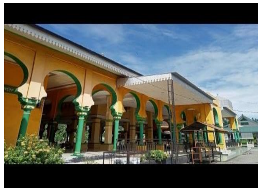
Gambar 2. Taman dan di belakang tempat wudhu

Selain taman, pada kawasan Masjid Al Osmani yang merupakan masjid kerajaan ini juga terdapat beberapa kompleks pemakaman berupa lahan dengan bentuk persegi panjang yang terdapat pada sisi utara, barat, serta selatan dari kawasan. Makam-makam tersebut dibatasi/dipagari oleh pagar-pagar besi pada sekelilingnya.